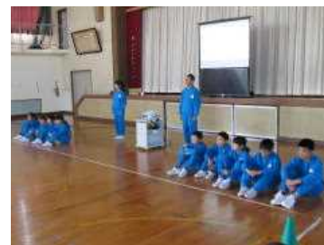
チューズデー集会